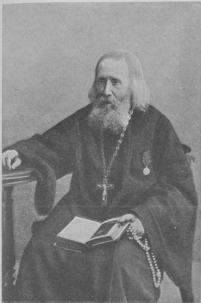
Симеона Вар. нва